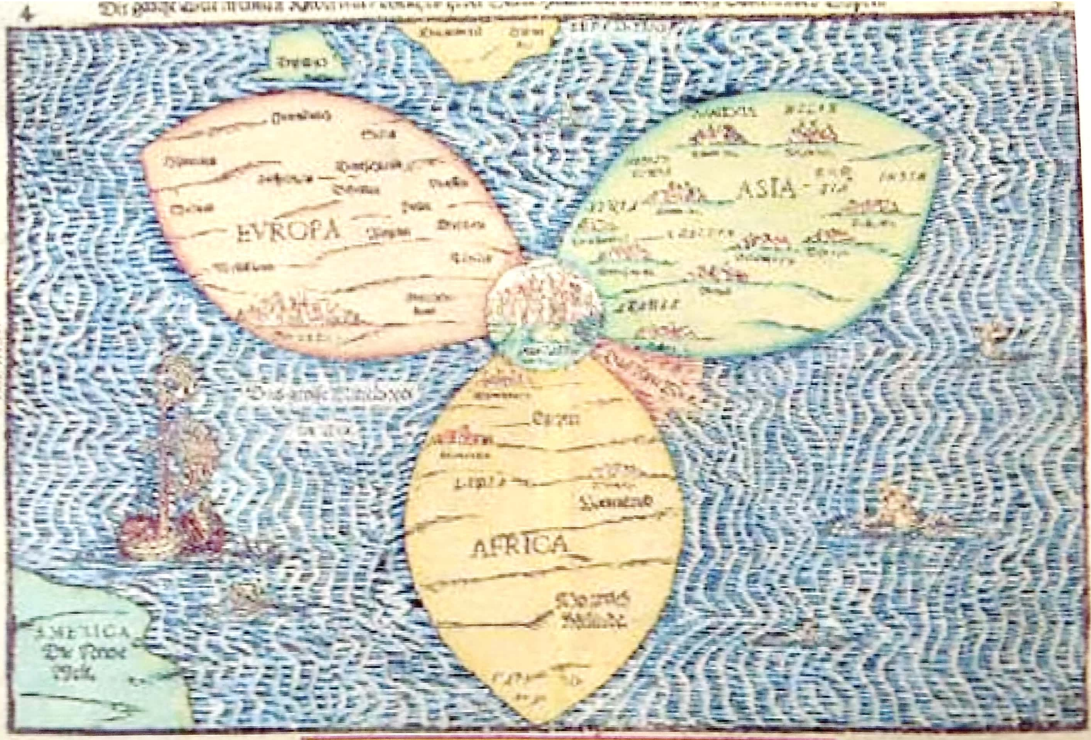
מפה 6: העולם - מפת התלתן